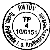
Dipl.-Ing Ulrich amtlich anerkannter Sachverständiger für den Kraftfahrzeugverkehr